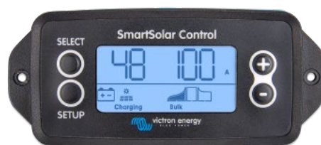
Écran à brancher SmartSolar

Retirez simplement le joint en caoutchouc qui protège la prise sur le devant du contrôleur puis insérez l'écran.